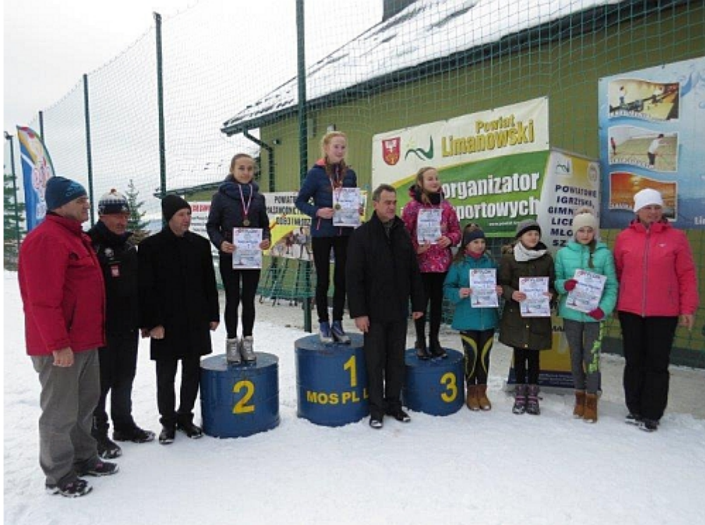
fol. MOS L-wa

Kategoria - chłopców ur. 2005r. - dystans 2km CL