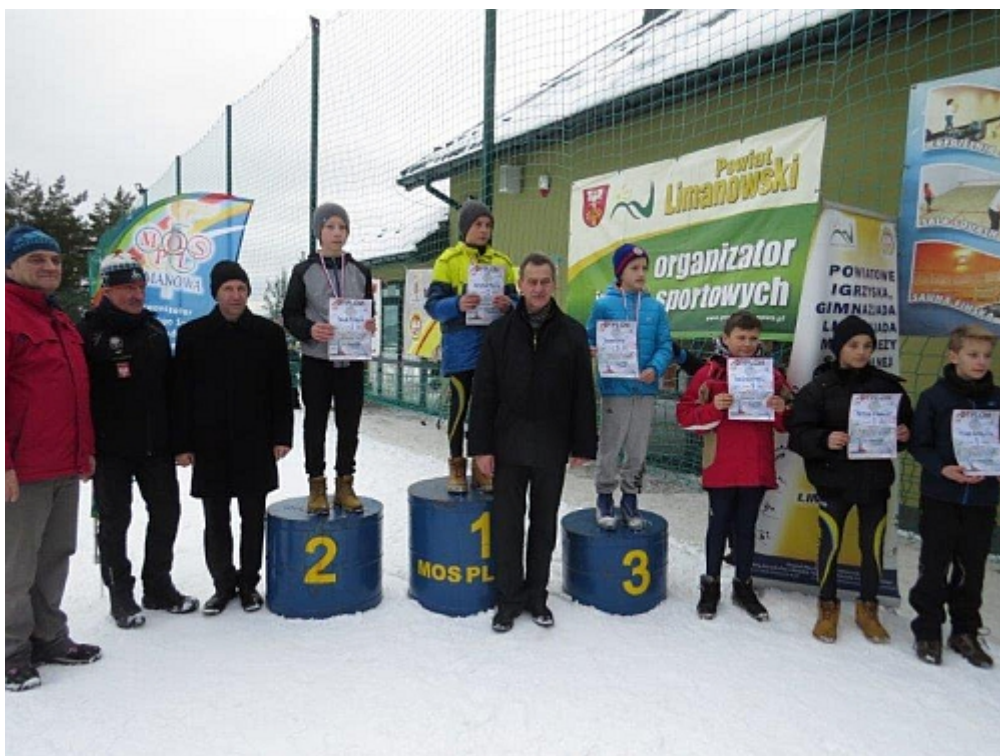
fol. MOS L-wa

Kategoria - dziewcząt ur. 2005r. - dystans 2km CL